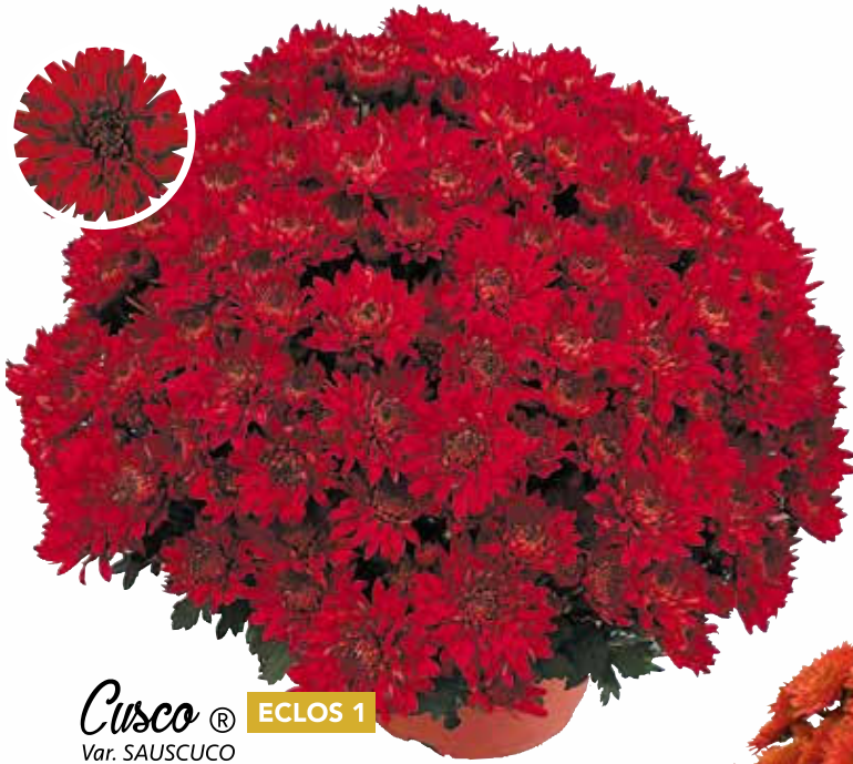
Cusco ® ECLOS 1 Var. SAUSCUCO

Rouge vif Port : souple Fleur : grand et double Diamètre : 55 cm Floraison : S41-42 Pincement : sans