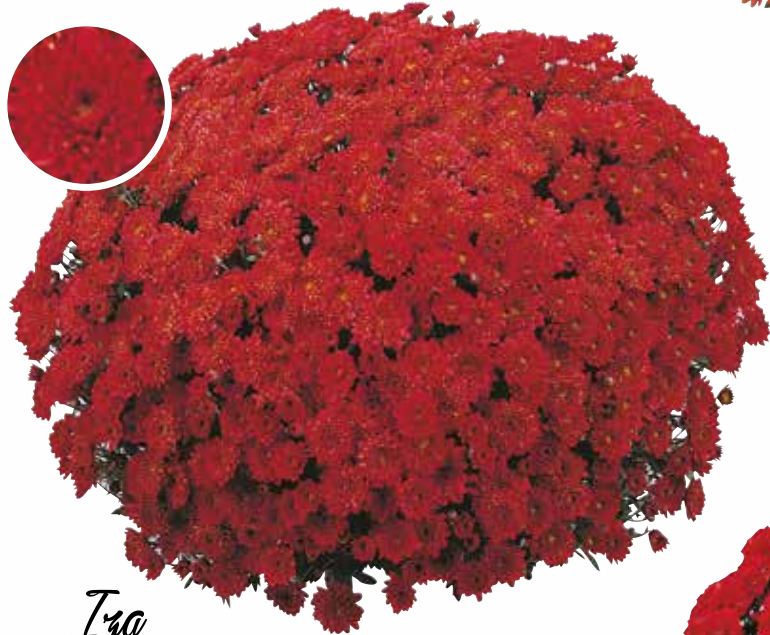
Iza Var. GUITIZA c.o.v.*

Rouge Port : souple Fleur : alvéolée Diamètre : 55-60 cm Floraison : S42 Pincement : avec ou sans Caract. : fleur remarquable mutation de la variété Touchka