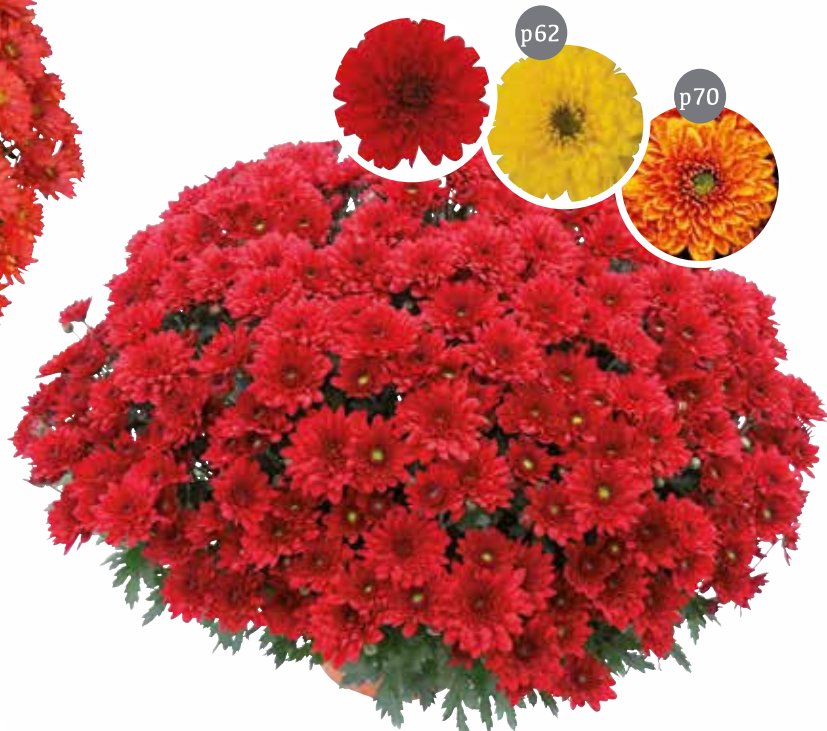
Jinka ® rouge

Rouge Fleur : double Diamètre : 60 cm Floraison : S41 Pincement : sans