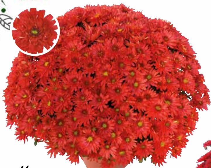
Nuage rouge ECLOS 1