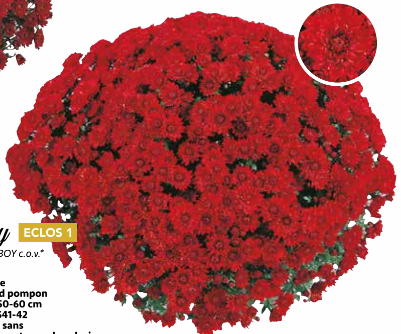
Taxiboy ECLOS 1 Var. GUITXIBOY c.o.v.*

Rouge Port : souple Fleur : semi-double Diamètre : 55-60 cm Floraison : S42 Pincement : sans Caract. : petite fleur