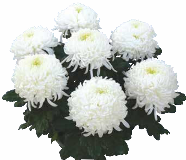
Rosée d'une nuit ® blanc Var. GUITSORUINBLAN

Blanc D.P. : 15-25 juin Fleur : incurvée Hauteur : moyenne Ramification : bonne Caract : sport de la variété Rosée d'une nuit rose